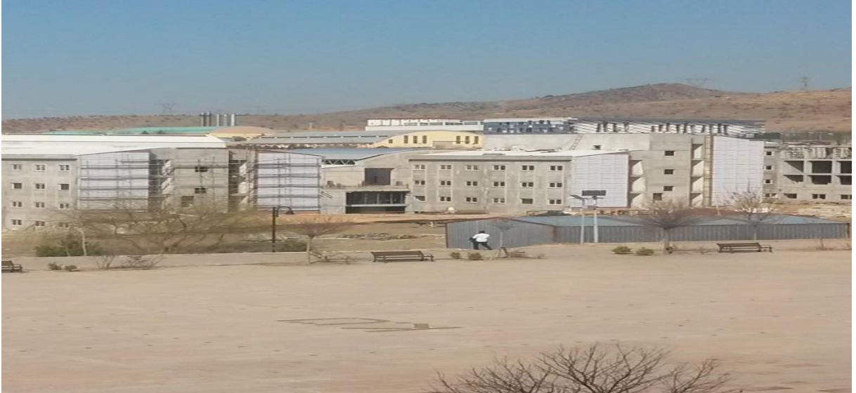
Fen-Edebiyat Fakültesi İnşaatı