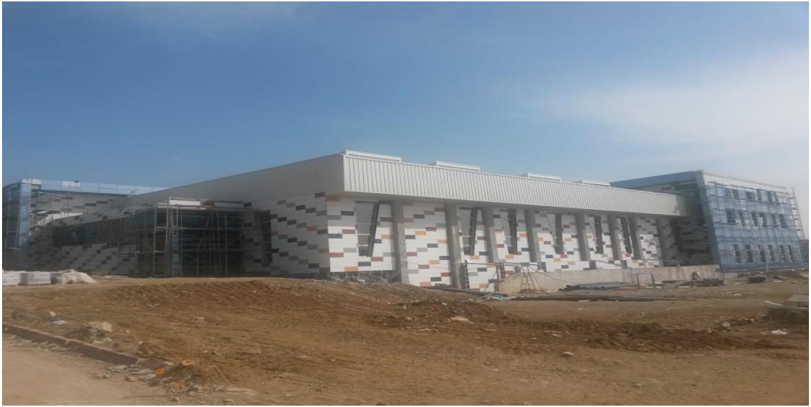
Açık ve Kapalı Spor Tesisleri İnşaatı

1997H050180 proje numaralı Açık ve Kapalı Spor Tesisleri İnşaatına 2015 yılında başlanılmıştır. Proje kapsamında 6 kulvarlı yarı olimpik kapalı yüzme havuzu, çalışma havuzu, çok amaçlı spor salonu, 536 kişi kapasiteli tribün, minderli salon, squash, fitness, 22 adet büro ve ofis, sığınak, havuz kafeterya, fuaye, 3 adet derslik, 1 adet açık halı saha, 1 adet açık tenis sahası, 1 adet açık basketbol-voleybol sahası bulunmaktadır. Toplam 9.600m 2 'lik Açık ve Kapalı Spor Tesisleri inşaatına 2015 yılı ekim ayında başlanmış ve 2015 yılı sonunda % 17 seviyelerine ulaşan inşaat 2016 yılsonu itibariyle %70'lere gelmiştir. 2016 Yılı Yatırım Programı ile projeye 3.000.000,00 TL ödenek ayrılmış yıl içerisinde de 2.600.000,00 TL likit ödenek eklenerek ve Derslikler ve Merkezi Birimler Projesi ödeneğinden 2.200.000 TL aktarma yapılarak proje ödeneği 7.800.000,00 TL'ye ulaşmış ve ödeneğin tamamı harcanmıştır.