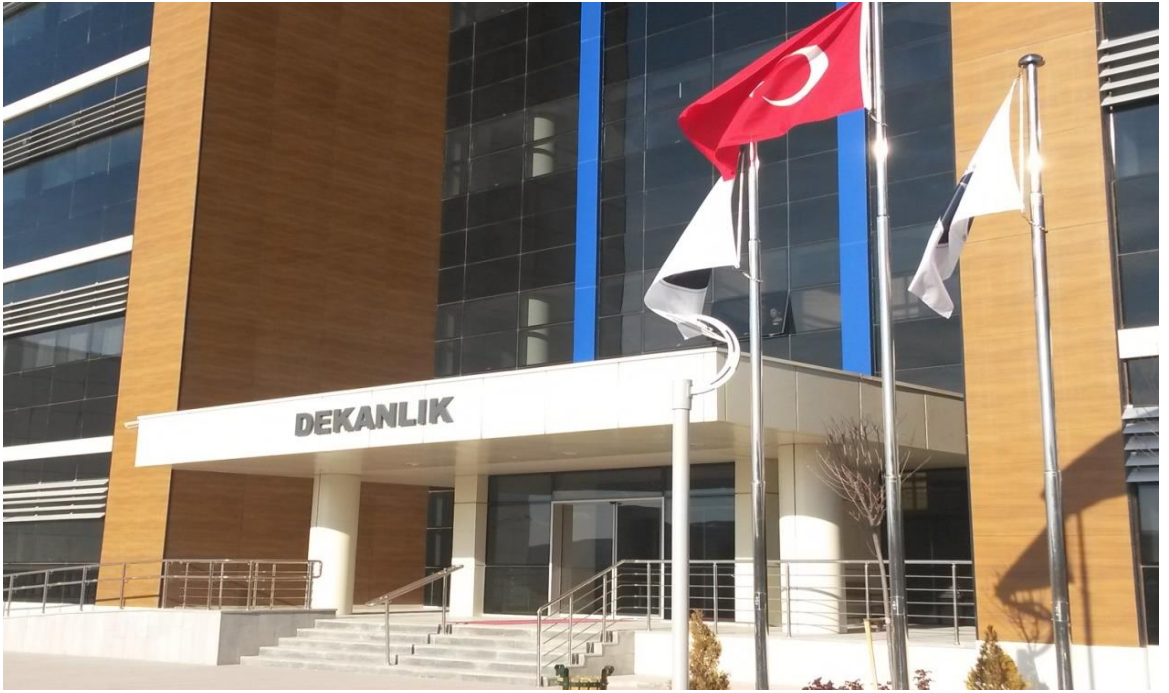
Diş Hekimliği Fakültesi