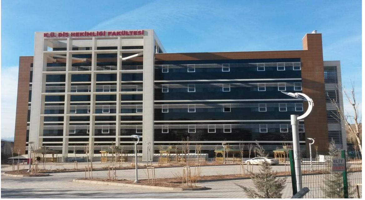
Diş Hekimliği Fakültesi