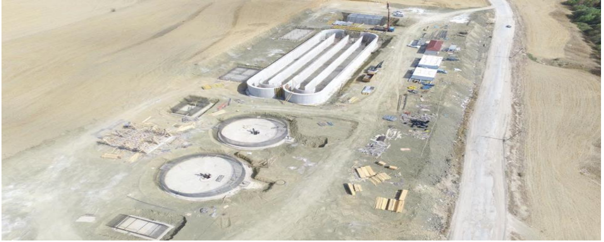
Atık Su Arıtma Tesisi İnşaatı