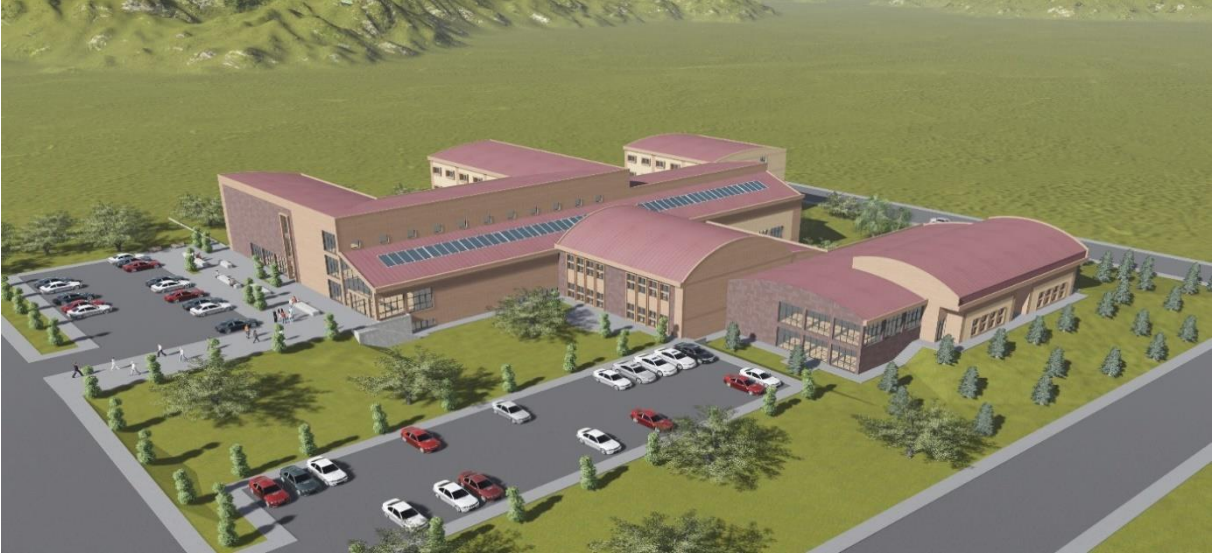
Fen-Edebiyat Fakültesi İnşaatı Projesi