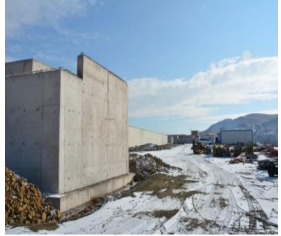
Atık Su Arıtma Tesisi İnşaatı