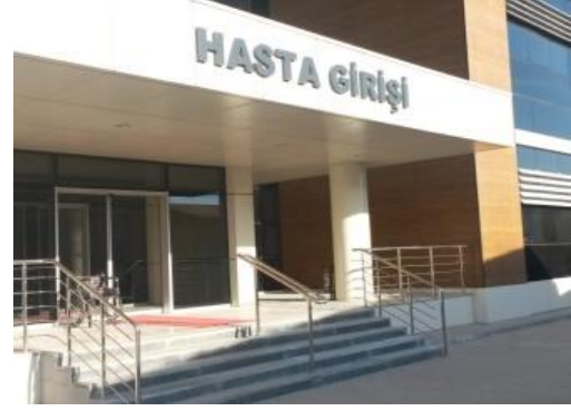
Diş Hekimliği Fakültesi